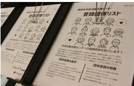
今年度の登録団体リストも館内配布中です。

登録団体ってどんなことをしているの? 貸出施設を使ってみたいけど、そもそもどんなところなの? というような疑問に、実際に活動している団体や、施設の使い方を紹介してもらえよう、と、創刊しました「スッペ!」。いかがでしたでしょうか。今後楽しい記事をお届けしたいと思います。