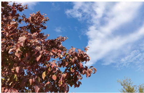
街路樹もすっかり紅葉しました。短い秋です。

10月から、新型コロナウイルス感染症対策として短縮されていた利用時間などが、一部緩和されることとなりました！一方で、マスクの着用をはじめとした各種制限は続いております。皆様にはまだまだご不便をおかけしますが、ご理解、ご協力をよろしくお願いたします。お寒い折、どうぞご自愛ください。